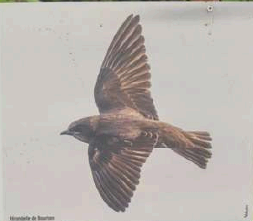
Hirondelle de Bourbon